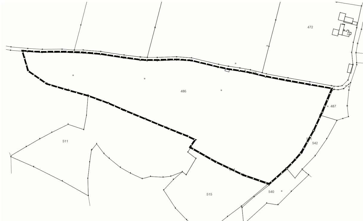
Die Lage und Abgrenzung des Geltungsbereiches (maßstabslos).