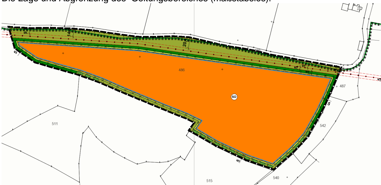
Abb. Darstellung des Vorhabens (ohne Maßstab)

Ziel der Planung ist die Ausweisung eines Sondergebietes für eine Freiflächen-Photovoltaikanlage innerhalb eines nach dem Erneuerbare-Energien-Gesetzes „landwirtschaftlich benachteiligten Gebietes“, um dem Bedarf an erneuerbaren Energien zu entsprechen.