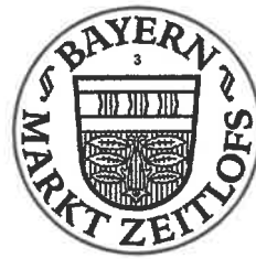
Matthias Hauke Erster Bürgermeister